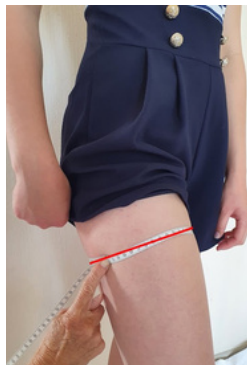
14. Tour de cuisse: