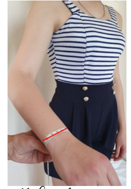
7. Tour de poignet: à prendre au niveau de l'os du poignet