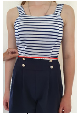
2. Tour de taille: à prendre au plus creux de la taille