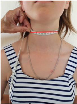
8. Tour de cou: tour à prendre au plus fin du cou