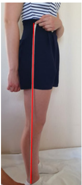
12. Hauteur latérale: à prendre de la taille à la cheville