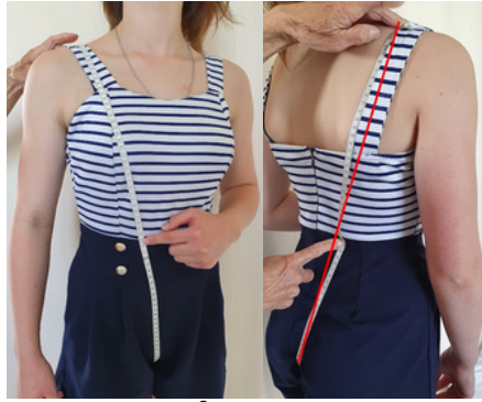
5. Tour de tronc: à partir de l'épaule, faire passer le mètre sur la pointe du sein, l'entrejambe et revenir dans le dos jusqu'à l'épaule. (bien plaquer le mètre au corps)