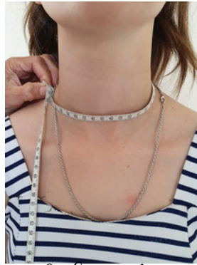
9. Tour encolure: tour à la base du cou