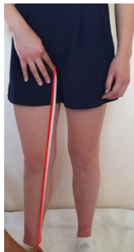
13. Hauteur entrejambe: à prendre de l'entrejambe à la cheville