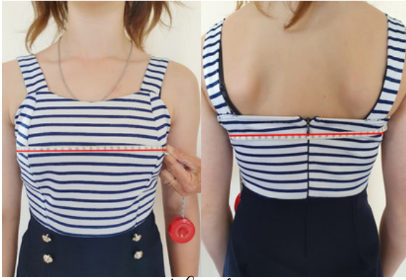
1. Tour de poitrine: à prendre sur la poitrine