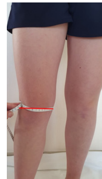
15. Tour de genoux: