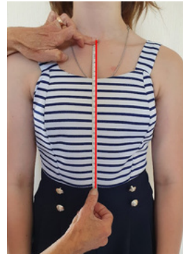
10. Hauteur milieu devant: à prendre du creux du cou jusqu'à le taille