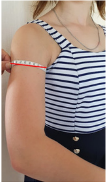
4. Tour de bras: à prendre sur le biceps