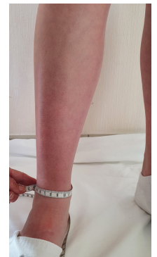
16. Tour de cheville: